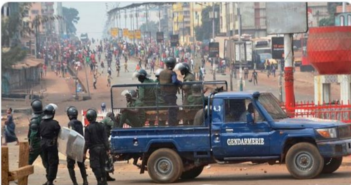
Guinée : Répression du droit de manifester